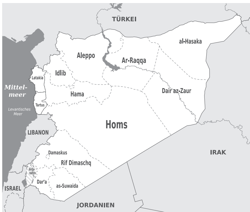
Podział administracyjny Syrii ( Governorates divisions of Syria , Wikimedia Commons, CC BY-SA 3.0).

początku konfliktu było 26 500; 18 000 w archieparchii Aleppo 69 , 4000 w eparchii Al-Qamisli 70 i 4500 w patriarchalnym egzarchacie Damaszku 71 . Apostolski wikariat Aleppo skupiający syryjskich rzymskich katolików liczył 13 000 wiernych w 2010 roku 72 . Liczba protestantów jest trudna do ustalenia, gdyż brak jest oficjalnych